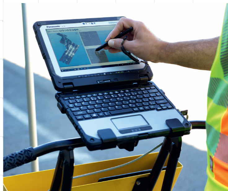
L'écran du moniteur reproduit en niveaux de gris les réflexions produites par le radar.